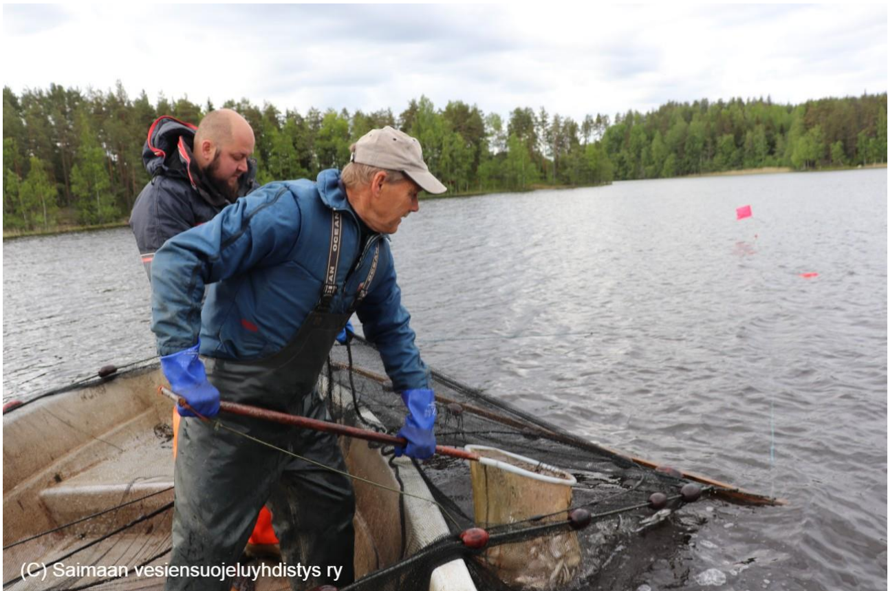
Kuva 1: Hoitokalastusta Kuuksenenselällä 2023

Hankkeen toimenpiteet jatkuvat vuonna 2024, mikä korostaa pitkäjänteistä sitoutumista vesistön tilan parantamiseen.