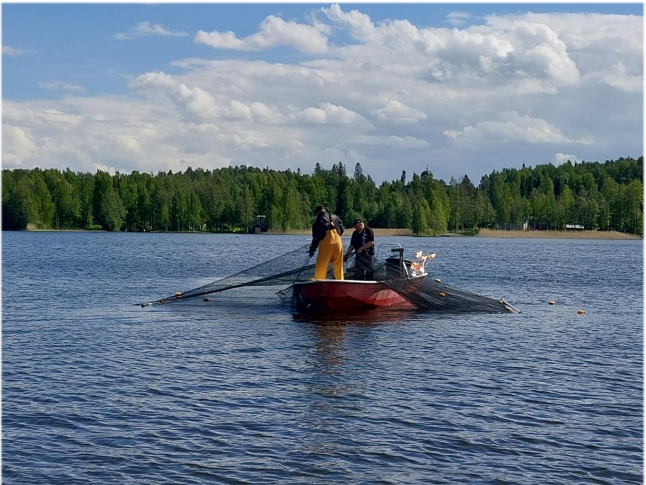
Kuva 2. Rysien koentaa Kirkkoselällä

Vuoden 2022 aikana kalastuksien kokonaissaalis oli 27810 kg. Kevään rysäkalastuksissa saalis oli 9510 kg ja syksyn nuottakalastuksissa 18300 kg. Vuoden 2022 kalastuksien kokonaissaaliista oli 37% salakkaa, 31% särkeä, 29% lahnaa ja 3% ahventa.