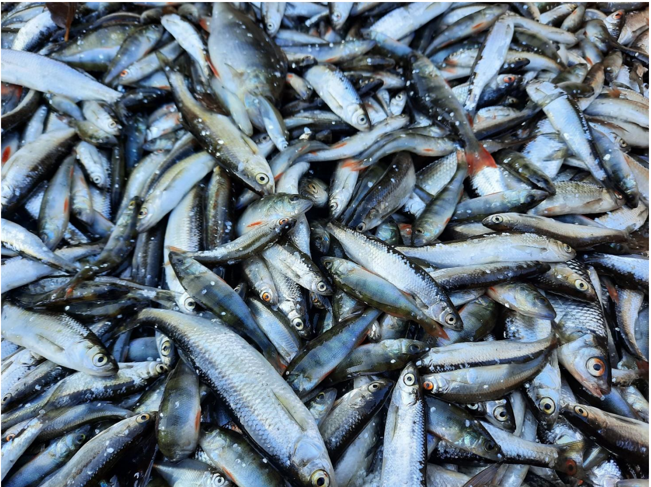
Kuva 1: Hoitokalastussaalista Kuuksenenselältä 2021

Kuuksenenselkä kuntoon -hankkeessa on toteutettu hoitokalastuksia vuosina 2016-2021. Kalatalouskeskus on hoitanut hoitokalastuksen koordinoinnin. Hoitokalastussaaliin määrä on ollut laskeva vuodesta 2016 lähtien. Saaliin määrä oli vuonna 2021 lähes sama kuin edellisenä vuonna, sillä määrä oli vain 2 % matalampi kuin vuonna 2020. Kuitenkin hoitokalastuksen vuosittaiset kokonaissaaliit sekä massayksikkösaaliit ovat laskeneet pitkällä aikavälillä reilusti. Hoitokalastuksen saalismäärä oli vuonna 2021 noin 64 % matalampi kuin ensimmäisenä hoitokalastusvuonna 2016. Vuonna 2021 rysäpyyntiä suoritettiin kahden viikon aikajaksoina kesällä (27.5-11.6.21) ja syksyllä (23.8.21-7.9.21) Kuuksenenselällä, Uiminkapialla ja Ruominkapialla. Koentoja oli vuonna 2021 yhteensä 309 kappaletta. Vuonna 2021 hoitokalastussaaliksi oli yhteensä 8501 kiloa ja yksikkösaaliiksi saatiin 27,6 kg/rysä. Saaliiksi saatiin salakkaa, särkeä, ahventa (< 15 cm) ja lahnaa sekä sorvaa. Rysistä saatiin petokaloina kuhaa, ahventa (> 15 cm), haukea sekä yksi taimen, jotka vapautettiin pyynnin yhteydessä takaisin vesistöön (Kuuksenenselkä kuntoon hankkeen hoitokalastukset No 3311/21). Hanke jatkuu vuonna 2022 samalla budjetilla edellisvuosiin verrattuna hoitokalastuksen osalta.