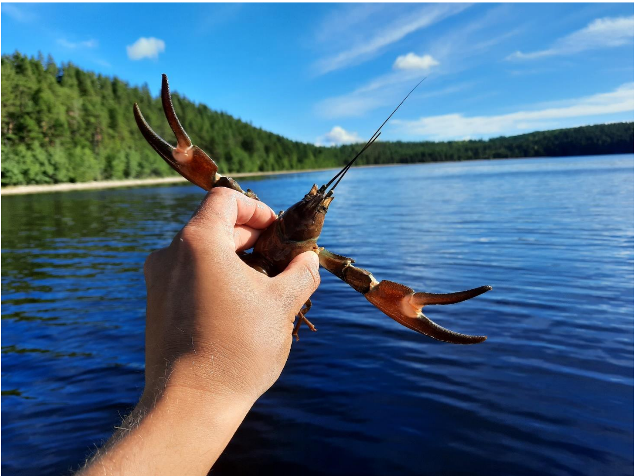
Kuva 2: Rapu täplärapukannan seurannan vertailualueelta

Eteläisen Saimaan täplärapukannan seuranta on osa Etelä-Saimaan kalatalousmaksujen käyttösuunnitelman töitä ja seurannan on suorittanut Etelä-Karjalan Kalatalouskeskus ry yhdessä Itä-Suomen yliopiston kanssa. Täplärapukannan tarkkailusta on tehty erillinen hankesuunnitelma. Eteläisen Saimaan täplärapukantaa seurattiin kolmella alueella: Joutsenon sellutehtaan vaikutusalueella ja vertailualueilla. Yksi koeapaja oli sellutehtaan mahdollisen vaikutusalueen ytimessä. Toinen ja kolmas koeapaja oli kauempana sellutehtaan vaikutusalueesta ja vähemmän tai ei lainkaan alttiina sellutehtaan mahdolliselle vaikutukselle. Eri tavoin sijoittuneiden koealueiden vertailu antaa tietoa sellutehtaan toiminnan mahdollisista vaikutuksista täplärapukantaan. Seuranta-aineistoa on tarkastelua varten yhdistetty koeravustajittain koko ravustuskauden ajalta. Täplärapukannan seuranta tehtiin kolmella eri koeapajalla, joissa kullakin koeapajalla oli 29-30 merta. Koeapajien koko saaliista määritettiin seuraavat eteläisen Saimaan täplärapuja kuvaavat muuttujat: selkakilven pituus, sukupuoli, saksien lukumäärä ja vauriot, naaraiden lisääntymisvalmius, rapuruttoinfektion aste (vakavuusaste 0 – 2), pyrstöjalkataudin esiintyminen (vakavuusaste 0 – 3) ja muut mahdolliset erityiset havainnot.